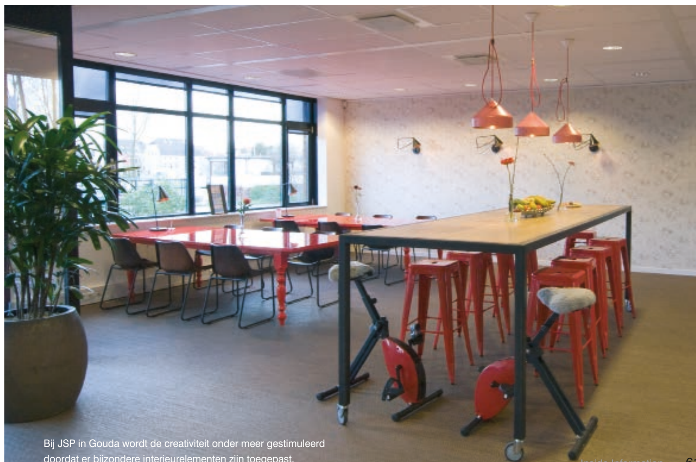
Bij JSP in Gouda wordt de creativiteit onder meer gestimuleerd doordat er bijzondere interieurelementen zijn toegepast.